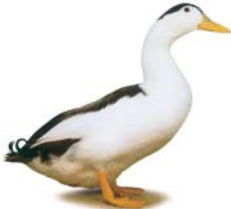
Altrheiner Elsterente (Magpie-Ente) Braungescheckt